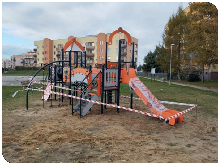
plac zabaw os. Różane

placu zabaw przy blokach 22, 23 i 24 zamontowano karuzelę-młynek i duży modułowy zestaw zabawowy.