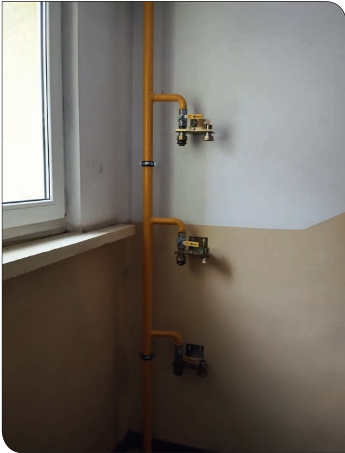
os. Błękitne 17 - wymiana instalacji gazowej

czy gazowych umieszczonych na klatce schodowej do odbiorników gazu w mieszkaniach.