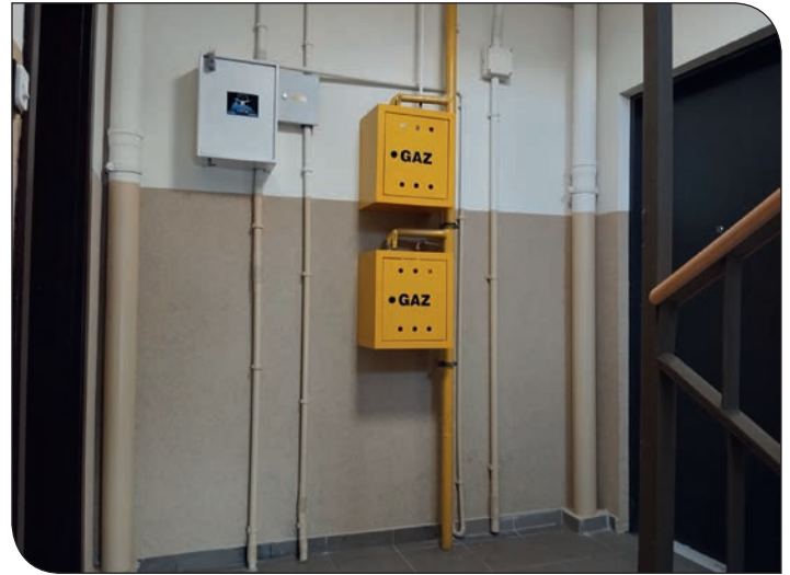
os. Błękitne 20 - klatka schodowa po remoncie