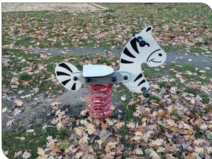
plac zabaw os. Tęczowe