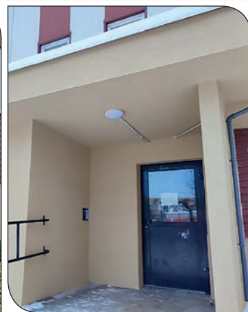
...oraz wejście do klatki - przed i po remoncie