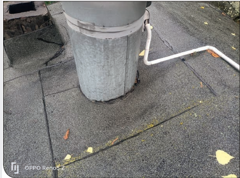
os. Jasne 24 - dach przed remontem

wej powierzchni dachu, renowacja obróbek blacharskich, remont ścian kominowych lub ich renowacja, renowacja czap kominowych oraz wymiana wyłazu dachowego na nowoczesny wyłaz systemowy z kopułą poliwęglanową;