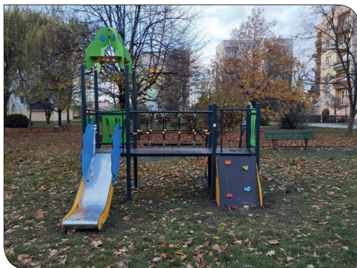
plac zabaw os. Tęczowe