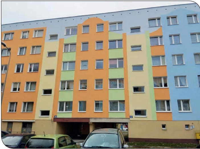
os. Błękitne 20 - nowa elewacja

dach, wymieniona została instalacja deszczowa, wymienione zostały poręcze oraz położona została mozaika ozdobna na ścianach klatki schodowej.