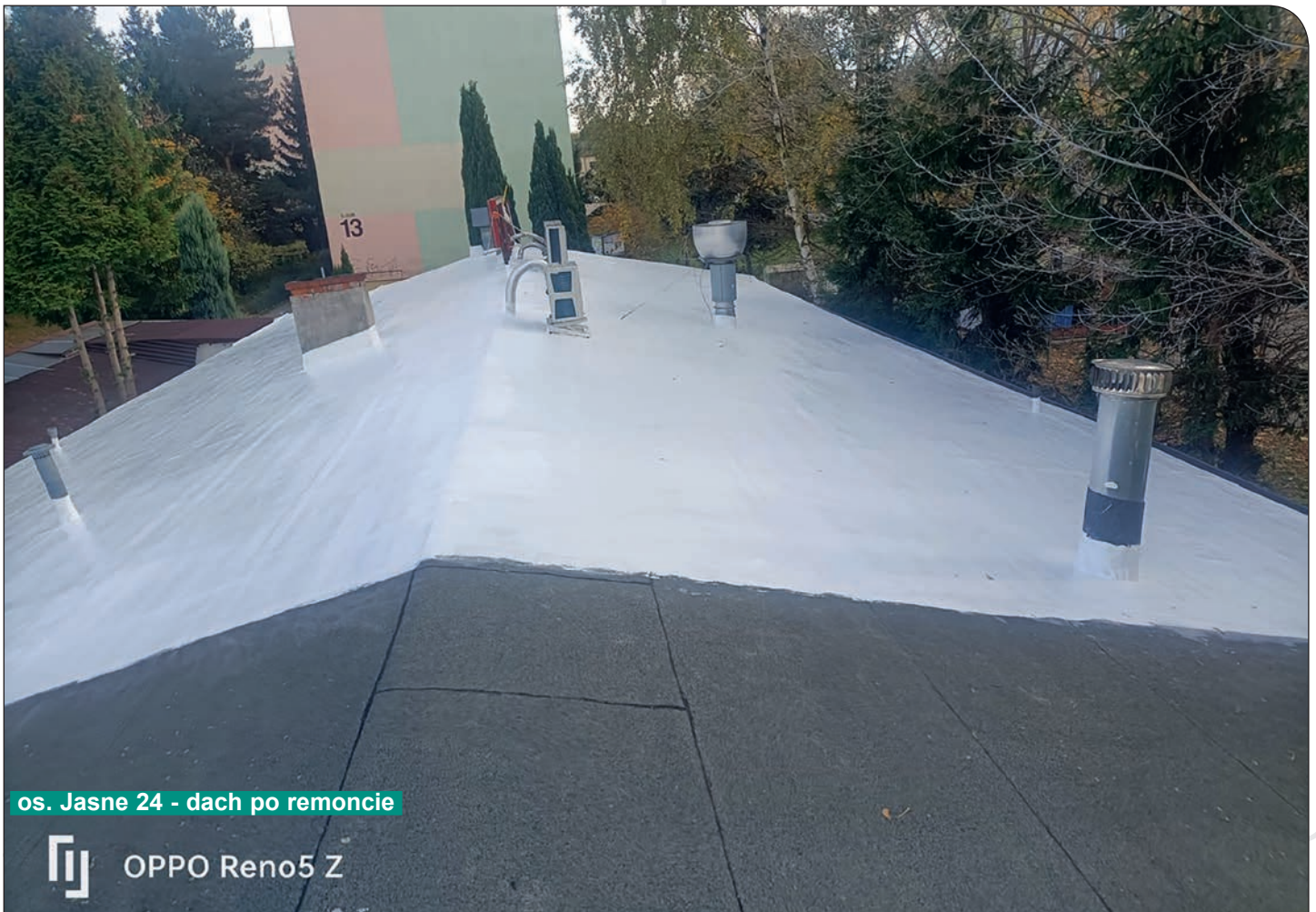
os. Jasne 24 - dach po remoncie