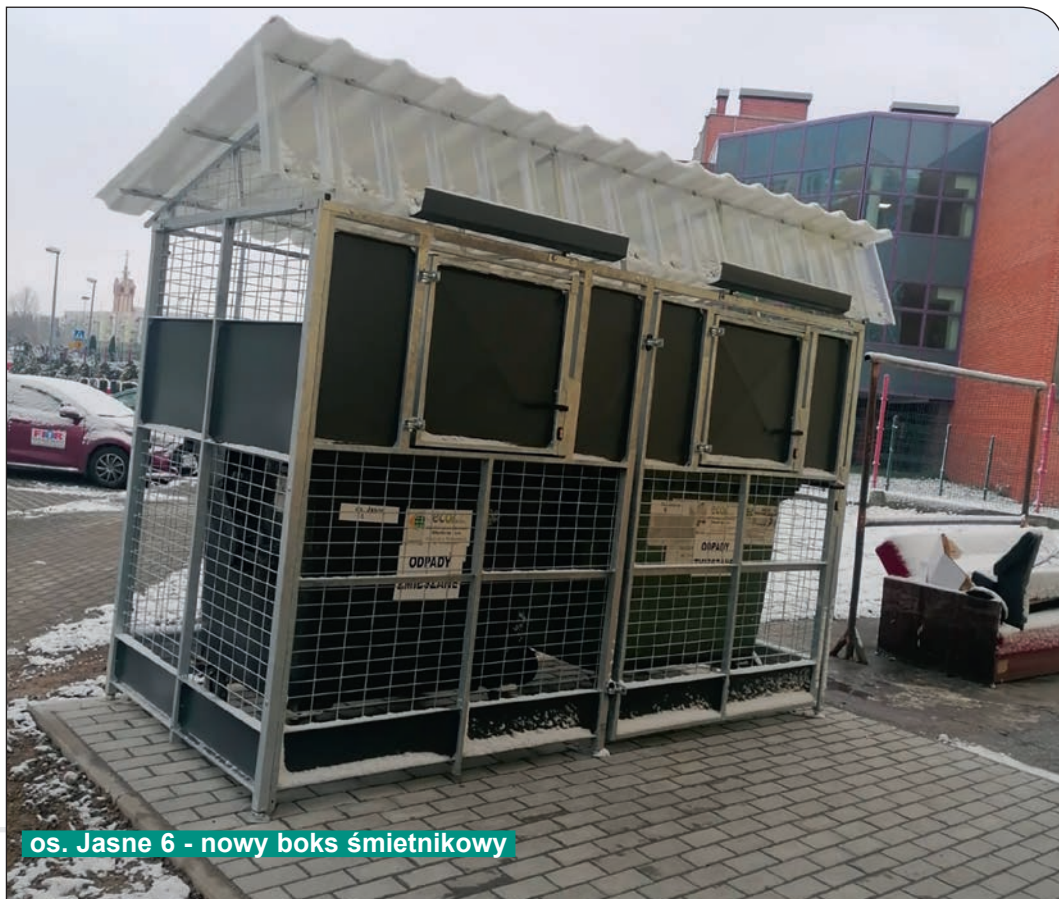
os. Jasne 6 - nowy boks śmietnikowy