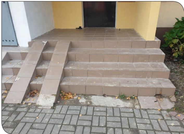
Różane 21 - schody przed remontem...