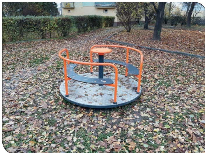
plac zabaw os. Tęczowe